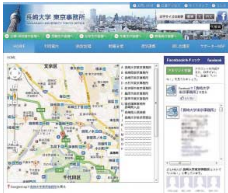
写真はトップページのイメージです。

東京事務所HPへのアクセスは、「長崎大学HP」のトップページより、画面左側のバナー「長崎大学東京事務所」をクリックして下さい。