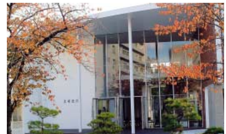
同窓会事務局がある良順会館(医学部敷地内)

引き継いで20号から現在125号まで続いている。82号以降は、名前を朋百(ポンペ)と変更した。ポンペの漢字表記が同級生百人を表すので選ばれた。原爆によって壊滅した長崎医科大学の復興には同窓会が多大な貢献をした。復興10周年には同窓会館を、復興20周年には記念講堂と体育館を建設した。近年も母校の発展を願って、創立130周年にはポンペ会館を、創立150周年には良順会館を建設した。同窓会事務局は良順会館内にある。