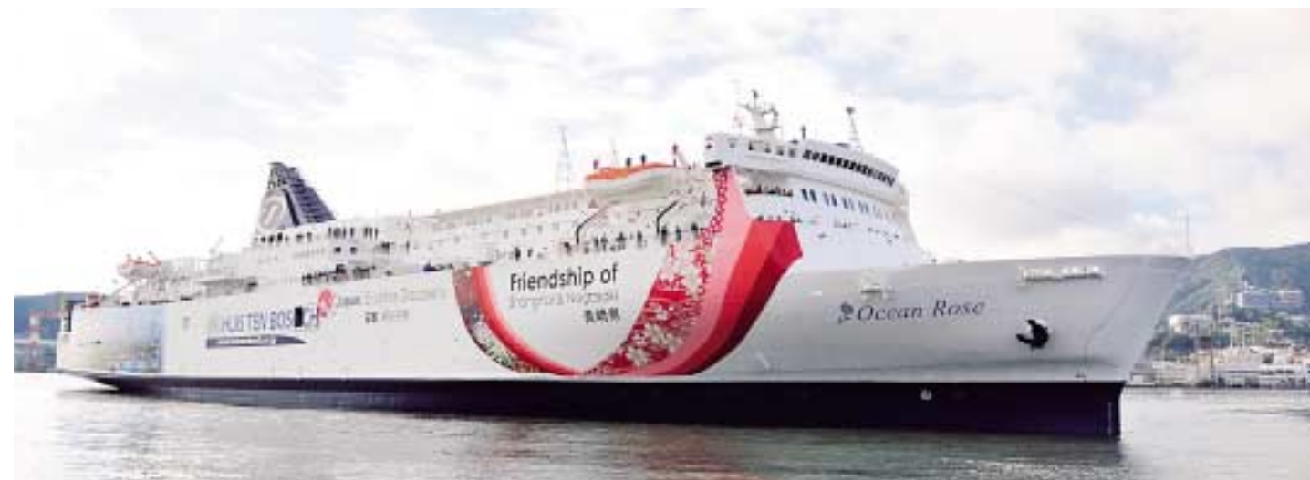
長崎—上海航路に就航したHTBクルーズの「オーシャンローズ」