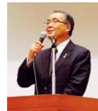
講演する中村法道長崎県知事