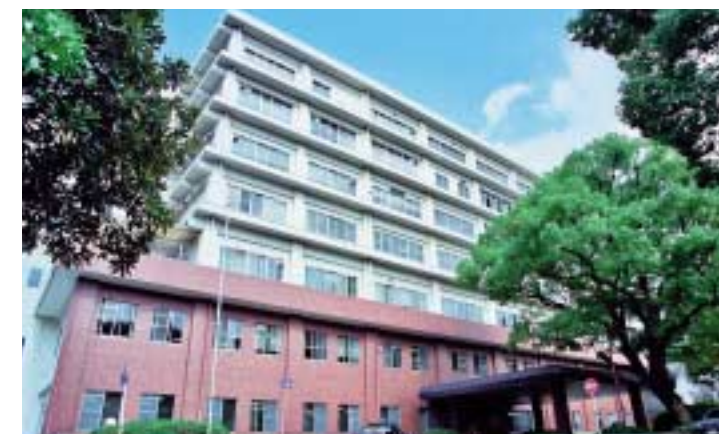
原爆くすの木が茂る歯学部玄関前

関係団体と共有するシステムを作り上げていくことなどを目標に活動を進めていく予定です。