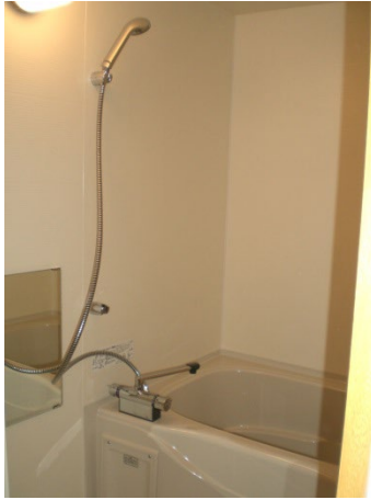
Room Facility 3