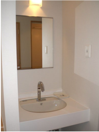
Room facility 2