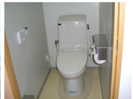
Room facility 1