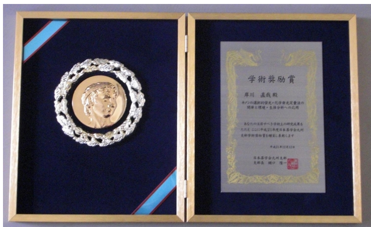
医歯薬学総合研究科 岸川 直哉 准教授

12月12日、医歯薬学総合研究科生命薬科学専攻環境薬科学講座薬品分析化学分野の岸川直哉准教授は「キノンの選択的蛍光・化学発光定量法の開発と環境・生体分析への応用」の研究により、平成21年度日本薬学会九州支部「学術奨励賞」を受賞しました。