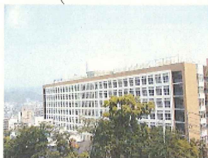
■歯科系診療部門棟