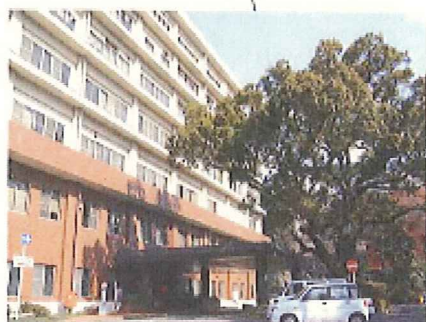
■歯科系診療部門棟