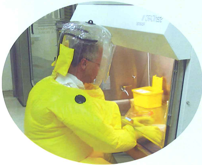
BSL-4施設での研究の様子

近年、交通や物資輸送の迅速化によって、世界の人々はより近い隣人として生活しています。地球のどこかで出現した新たな病原体もまたたく間に世界に拡散し健康被害を及ぼす危険性があり、長崎に住む我々も例外ではありません。このセミナーでは新しく出現する感染症や、病原性の強いウイルス性出血熱研究の世界の現状と、長崎大学の取り組みについて市民の皆様にはわかりやすく解説します。