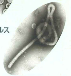
エボラ出血熱ウイルス

平成23年1月26日(水) 午後7時00分～午後8時30分 長崎市立図書館 新興善メモリアルホール (〒850-0032 長崎市興善町1-1)