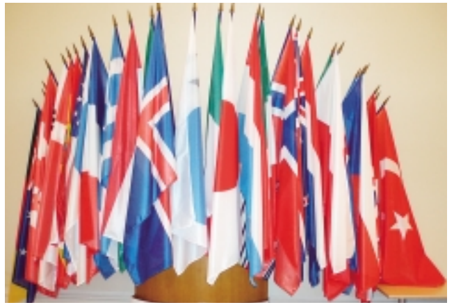
正面ロビーに設置された加盟30カ国の国旗

③ 途上国支援に貢献することを3大目的として設立されましたが、その後、国際社会・経済の多様化に伴いその活動範囲を広げ、現在では当初の目的に加え、環境エネルギー、農林水産、科学技術、教育、高齢化、年金・健康保険制度といった経済・社会の広範な分野で積極的な活動を行っています。