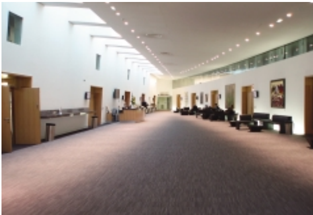
数多くの会議場を擁した OECD 本部

の下で先進国の水準に達していることが実質的に求められており、OECDに加盟すること自体が、「先進国である証」として一種のステータスとなっています。ちなみに、日本がOECDに加盟したのは1964年のことですが、これにより、日本は名実ともに先進国の仲間入りを果たすこととなりました。第2の特徴は、「世界最大のシンクタンク」と称されるとおり、政治・軍事を除き、経済・社会のあらゆる分野のさまざまな問題を取り上げ、研究・分析し、政策提言を行っており、活動対象分野が非常に幅広いことが挙げられます。第3の特徴は他の国際機関のように、各国間で対立のある問題について利害調整を図る場ではなく、