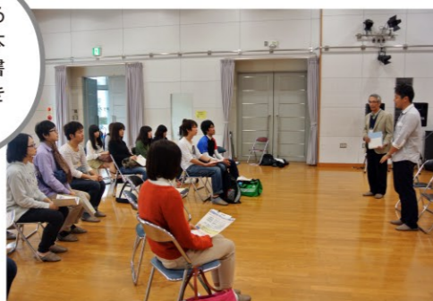
スタートアップ説明会で附属図書館のサポーターについてのオリエンテーション。このような学内のボランティアも時折あります。

サポーターになると、自分の好きな本が購入できる選書ツアーにも参加でき楽しいですよ