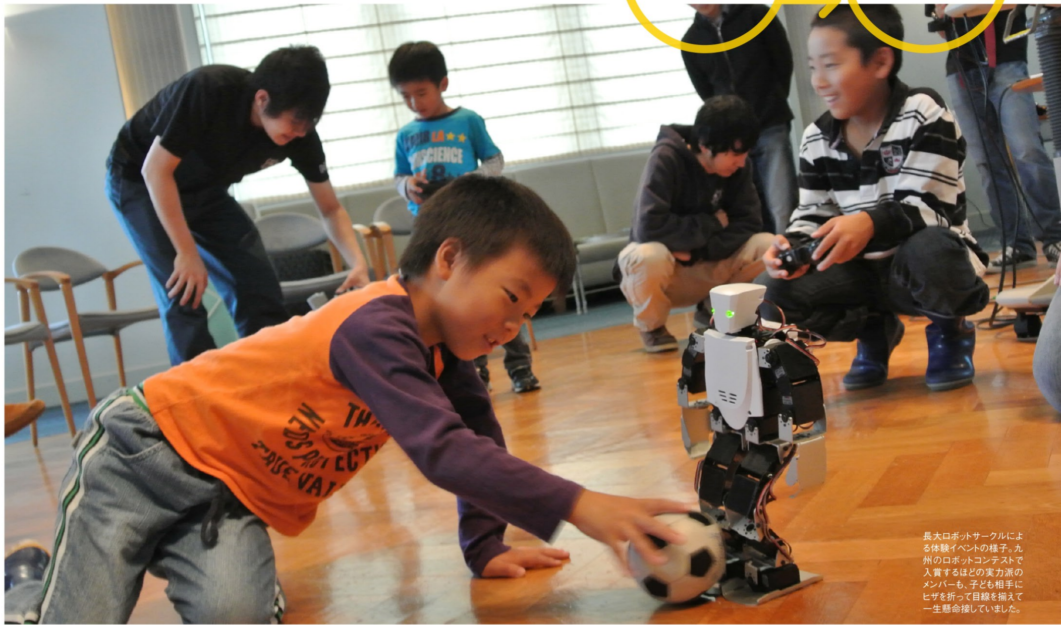
長大ロボットサークルによる体験イベントの様子。九州のロボットコンテストで入賞するほどの実力派のメンバーも、子ども相手にヒザを折って目線を揃えて一生懸命接していました。