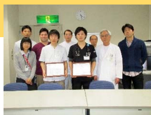
↑ 南相馬市立総合病院で症例発表し、表彰されました。