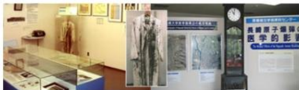
原爆医学資料展示室