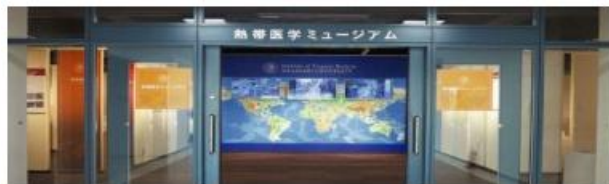
熱帯医学ミュージアム