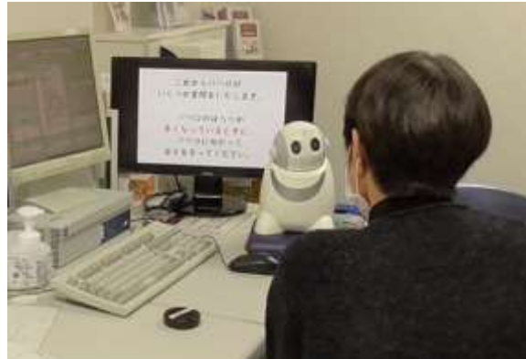
図2 長崎大学病院での実証実験の様子（2018年12月）