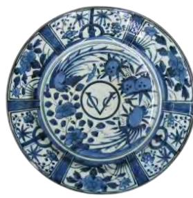
VOCマーク入染付平皿