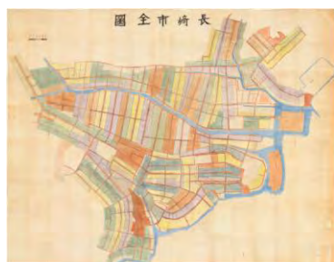
長崎箇所割大地図