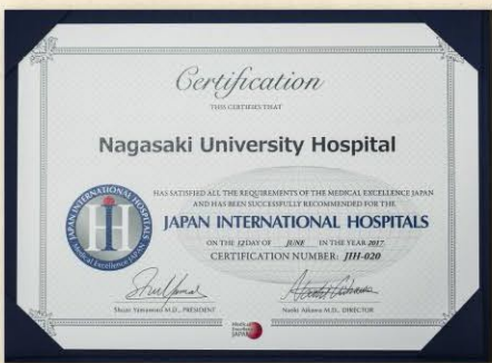
JIHの推奨証。専門病院や私立病院が認定されることが多い中で、国立大学病院としては全国で4番目に長崎大学病院が認定されました。

長崎大学大学院 移植・消化器外科教授。長崎大学医学部卒業。博士（医学）。米国シードーズ・サイナイ医療センター（Cedars Sinai Medical Center）、オランダのフローニンゲン大学病院を経て、二〇一六年まで副病院長。二〇一六年より現職。消化器外科 移植外科が専門。