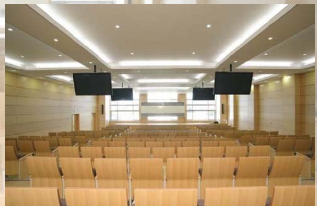
260名収容の新ホール