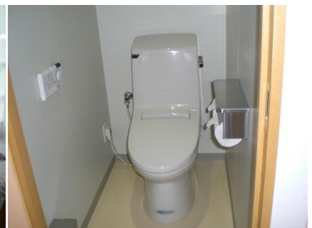
Room facility 1