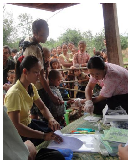
セポン郡におけるマラリア調査の風景