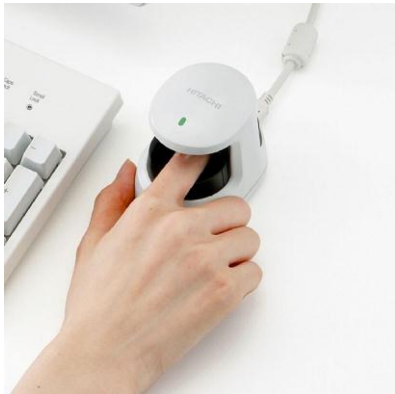
日立指静脈認証装置

指静脈認証技術は、日立が開発した生体認証技術で、指の静脈パターンで個人を認証するものです。近赤外線を指に透過させて得られる指の静脈パターンの画像から静脈の存在する部分を構造パターンとして検出し、あらかじめ登録した静脈の構造パターンと照合させて個人認証を行う技術です。指静脈は体内にある情報であるため、偽造や成りすましが極めて困難であり高いセキュリティレベルを実現します。日立では、2002年に指静脈認証装置を製品化して以来、ATMの本人認証やPCログイン、入退室管理など、さまざまな分野での適用を広げてきました。