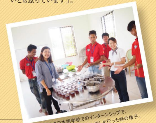
カンボジアにある日本語学校でのインターシップで、日本文化紹介の一環としてそめん流しを行った時の様子。

人たちのように、自分の意見や個性を自由に表現できる生徒を育てていきたいとも思っています」。