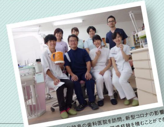
実習の一環として、与論島の歯科医院を訪問。新型コロナウイルスの影響で実習内容も制限されましたが、貴重な現場経験を積むことができました。

じることもあり、今後は大学院も視野に入れながら、さらなる専門知識の修得を目指していきたいです」。