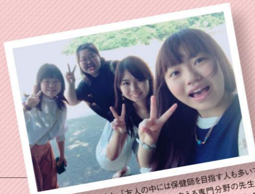
看護学専攻の仲間たちと。「友人の中には保健師を目指す人も多くいます。長崎は離島が多いので、地域医療を支える専門分野の先生もいます。大学院(修士課程)に新しく保健師養成コースもできました」。