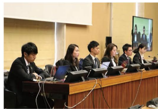
2018年にジュネーブで行われた核兵器不拡散条約(NPT)再検討会議に出席。各国の代表団の前でスピーチも行いました。

間にはギャップが生まれていますが、ウクライナの件もありますし、そもそもロシアからの脅威を見越すことはできないでしょう。核廃絶に踏み切るのは難しい状況なのかなと思います。最近、日本でも核シェアリングに関する議論が出たと思います。世界情勢を踏まえると、すぐに核兵器を無くすのは難しいかもしれません。答えは出ません。