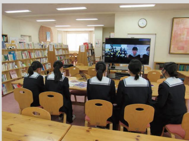
ピンチはチャンス。コロナ禍でオンライン交流という選択肢も増え、特に海外と交流できる可能性が広がりました。

戦争を終わらせるためという理由を知っても、正しいとは思いません。でも、世界にはそのような意見を持っている人もいます。だと、現実を理解できたことは良かったと思います」。