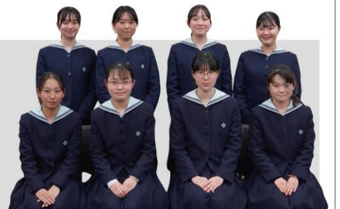
活水高校平和学習部の皆さん。3月には外務省主催の「かけしプロジェクト」に参加。9名がアメリカの高校生と現地交流予定です。

平和学習部は高校生1万人署名活動や他県の高校生との交流など、被爆地での学びを大切にしています。さまざまな形でメッセージを発信する中、長崎原爆の日である8月9日には校内で行われる平和集会で同部の1年生が平和宣言を発表。また、2021年には子どもたちの被爆証言を世界中に発信する「ふりそでプロジェクト」をスタートさせました。プロジェクトは3年生が代々担当し、冊子からウェブへ発信ツールは拡大中です。このように部活として、平和学習に取り