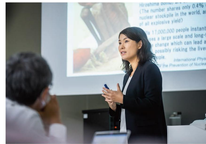
「若い人たちが自分の頭で考えて動き、自信を持って新しいものを作っていく。そして長崎から動き出せば、たくさんさんの刺激が得られるはず。それをサポートするのがRECNAの役目」と中村先生。

「長崎を最後の被爆地という願いが破られる、まさに崖っぷちに世界は立っています。長崎にいる私たちに何ができるのか、世界から問われる10年になるでしょう。正直、焦りもある一方、やはりこれまでと変わらず、じっくり着実に若い人たちと向き合っていきたいと思っています」。