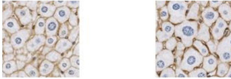
図1 Larginの過剰発現で大きくなった肝細胞（右）。左は対照群のマウスのもの。青く染められた核を1個もしくは2個含んだ茶色の枠で囲まれた区画が1個の細胞にあたる。