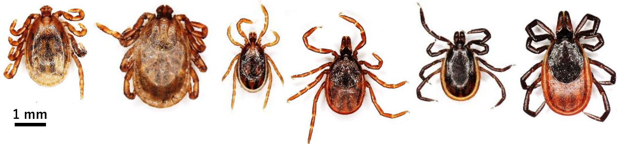
図 1. 北海道内でよく見られるマダニ (左から順に、オオトゲチマダニのオス、メス、ヤマトマダニのオス、メス、シュルツェマダニのオス、メス。特にヤマトマダニ、シュルツェマダニが人を刺すと言われている)