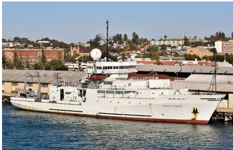
調査船 Thomas G. Thompson (2019年、フリーマントルにて撮影)。撮影: Bahnfreund. Wikimedia Commons より、クリエイティブ・コモンズ 表示-継承 4.0 国際ライセンスに基づき使用。

これまで OAWRS の試験は、米国東北岸やノルウェー沖など、比較的魚種が限定された海域で行われてきました。今回、世界有数の多様な魚種を誇る長崎沖で試験を行うことで、多種多様な魚群に対する探査精度の検証・研究を進めます。本技術は装置が大型であるため、直ちに漁業に導入される段階ではありませんが、水産資源の正確な把握や、持続可能な資源管理技術を飛躍的に発展させることが期待されています。