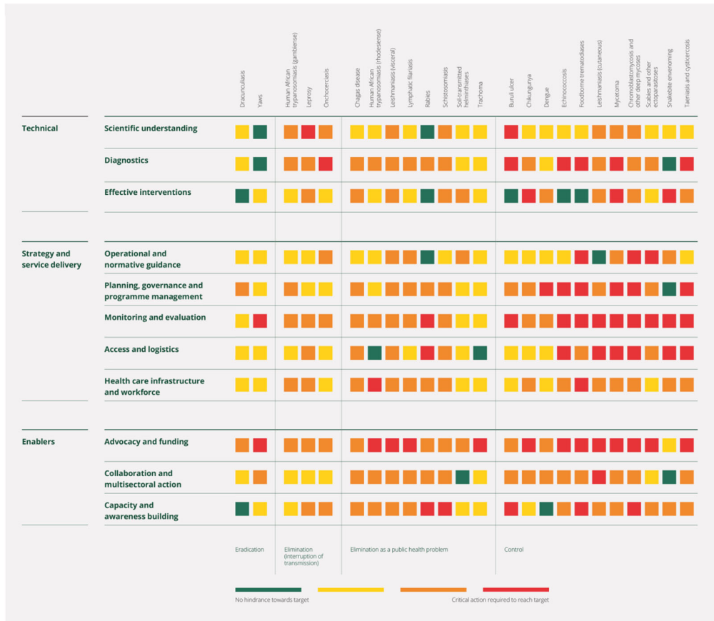
資料提供：WHO Global NTD Program 3

WHO NTD ヒートマップ（2019 年作成）では、すべての NTDs において、シンプルで安全かつ効果的な予防、診断、治療のためのツールが不足していることが明確に示されています。