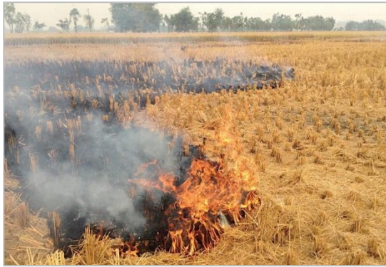
写真1：パンジャブ地方の稲わら焼きの例（2018年11月4日撮影、林田佐智子）