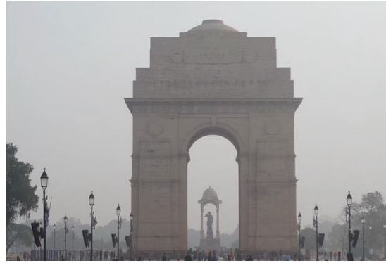
写真2：PM 2.5 の高濃度時におけるデリー首都圏での視界不良の様子（2023年1月14日撮影）