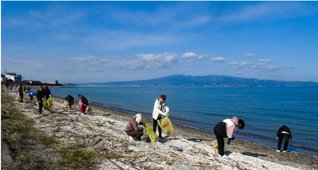
2023年1月に実施した神代海岸の清掃の様子

長崎大学のサークル「ながさき海援隊」が11月12日(日)、雲仙市神代(こうじろ)海岸で海浜清掃活動を実施します。