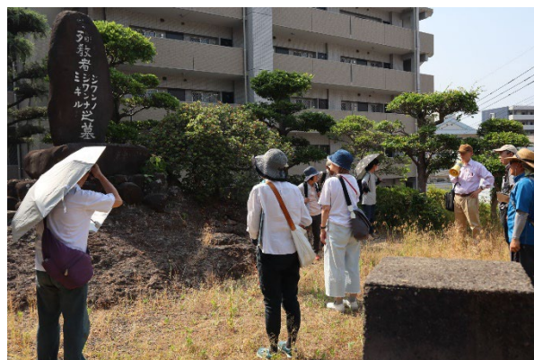
浦上フィールドワーク