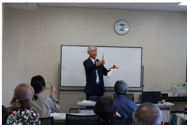
「神功皇后伝説」祭事について