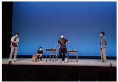
夏公演当日、チトセピアホールで本番前練習。