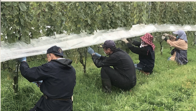
ワイナリーの収穫

子育て世代なら、例えば自然が豊かで新鮮な食材が豊富であることに親が自信を持ち、その後ろ姿を子どもに見せるのです。私のような高齢者は、病気やケガをせず、健康に過ごすことで、年寄りが年寄りとして暮らせる村だということを示したいです。地域ぐるみで「川内いよいよ教育」を続け、次の世代に伝えたいと思っています。