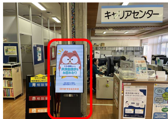
キャリアセンター