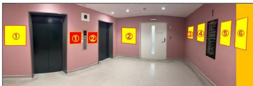
(職員用エレベーターホール写真)