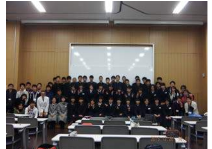
☆最後には記念写真も！☆