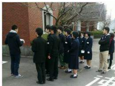
☆キャンパスを歩いたり☆