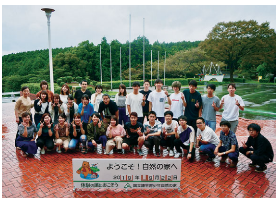
毎年20~30名程度の意欲あるプログラム生が誕生する(短期語学研修にて)

長崎大学経済学部における海外受入(外国人留学生)も年間40~50名程度で安定的に推移してきました。そのような中でグローバル力が身に付くしくみは講義外の日常にも広がっています。例えば、学生は外国人留学生のチューターとなって留学生の学習面、生活面を援助するとともに交流を推進します。また経済学部ではイングリッシュサポートルームを設置しており、昼休みにEnglish Caféを開設することで、留学生と国際ビジネスプログラム生同士が気兼ねない交流の時間を楽しみ、縦と横の繋がりが形成され、情報交換や精神的繋がりを大切にグローバル力を日