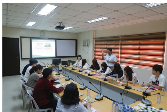
英語ディスカッションの様子